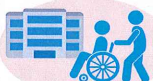
受診時や医療機関・ 高齢者施設などを訪問する時