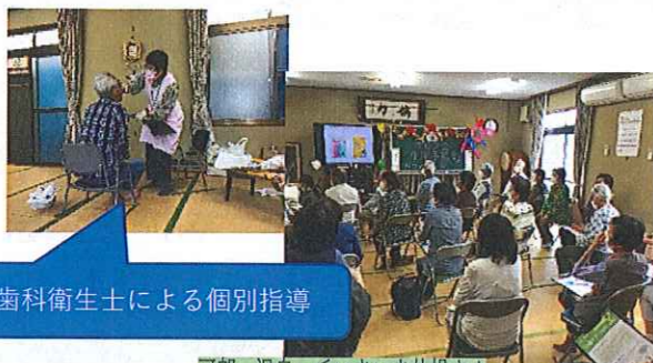
歯科衛生士による個別指導