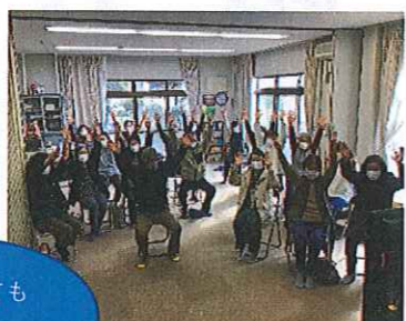
可部南 いきいきサロンもみじさん いきいき百歳体操