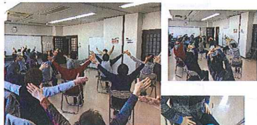
三入民児協・三入公民館さん 生き生き大学