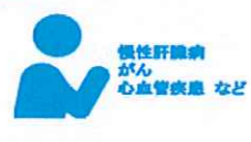
慢性肝臓病 がん 心血管疾患 など