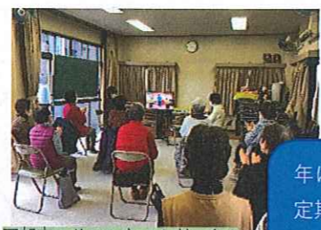
可部南 サロンらべんだーさん 体組成測定