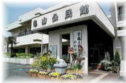
亀山公民館入り口