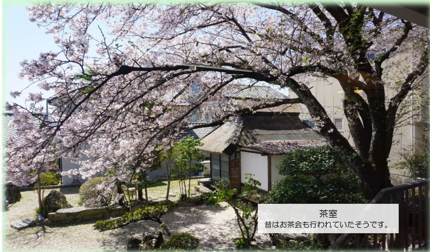
茶室 昔はお茶会も行われていたそうです。

中庭にある桜も、今年はいつもより早く3/20に開花いたしました。緑ヶ丘静養園の長い歴史の中で、ご利用者を見守り、楽しませてくれた桜です。春のお花見はもちろん、夏の青葉、秋の紅葉など、いつも生活に彩を与えてくれました。桜と一緒に写真を撮るなど、別れを惜しみました。