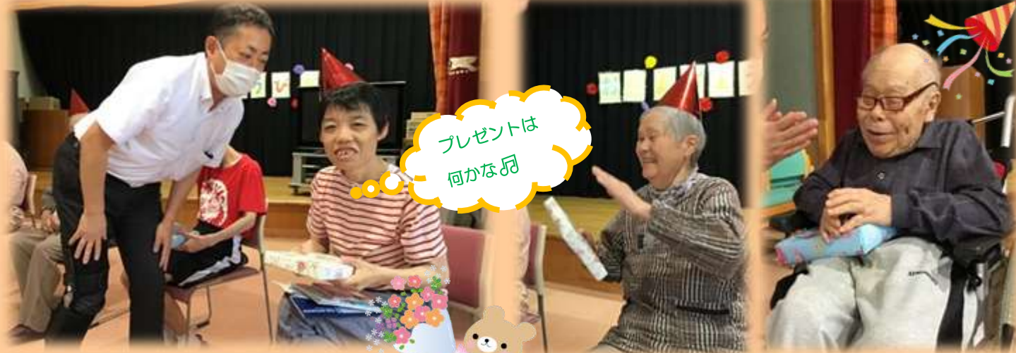
プレゼントは 何かなあ