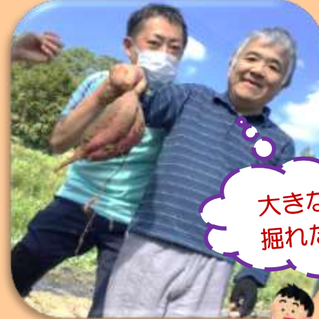
大きなお芋 掘れたよ!